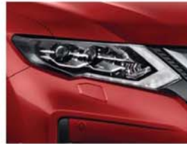
Solid Red – S – AX6