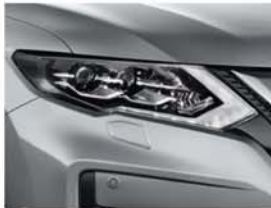
Silver – M – K23