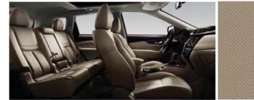
LEDER MIT PERFORIERUNG – BEIGE