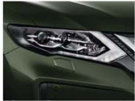
Titanium Olive – M – EAN