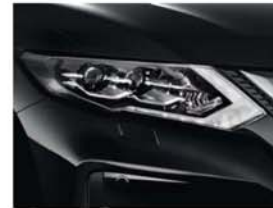
Black – M – G41