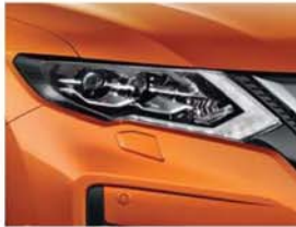
Orange – P – EBB