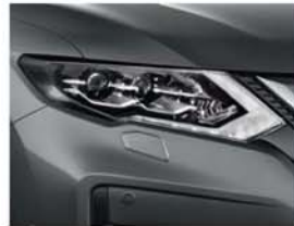
Dark Metallic Grey – M – KAD