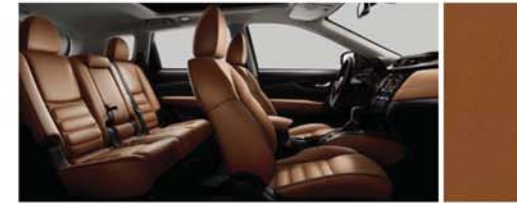
TAN-LEDER MIT SPEZIELLER STEPPNAHT UND SCHWARZEN EINSÄTZEN