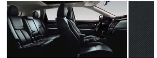
LEDER MIT PERFORIERUNG – SCHWARZ